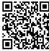
云南省高校计算机等级考试报名

使用浏览器访问测试系统，网址为 https://jsjks.ynjy.cn/yncre/ 。也可以微信扫码访问系统。